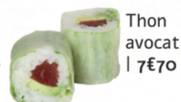
Thon avocat | 7€70