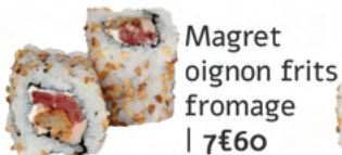
Magret oignon frits fromage | 7€60