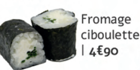
Fromage ciboulette | 4€90