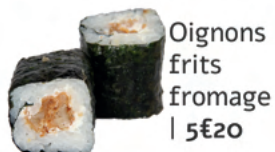
Oignons frits fromage | 5€20