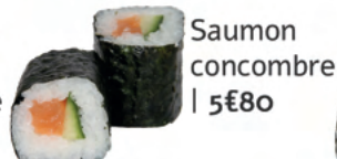
Saumon concombre | 5€80