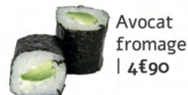
Avocat fromage | 4€90