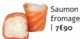
Saumon fromage | 7€90