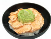
Saumon braisé | 17€50