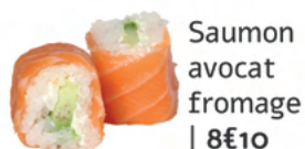
Saumon avocat fromage | 8€10