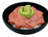
Thon | 17€50