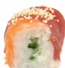
Ocean rolls Saumon, thon, concombre, fromage et billes de riz soufflé | 9€50