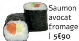
Saumon avocat fromage | 5€90