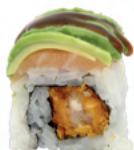
Dragon rolls Saumon, tempura de crevette, avocat et sce teriyaki | 9€50