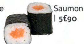
Saumon | 5€90