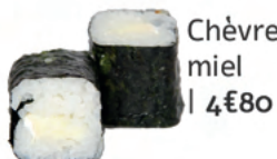
Chèvre miel | 4€80