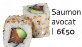
Saumon avocat | 6€50