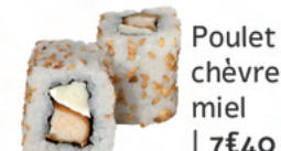
Poulet chèvre miel | 7€40