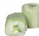
Avocat fromage | 6€50