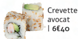
Crevette avocat | 6€40