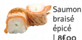
Saumon braisé épicé | 8€00