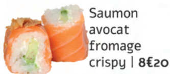
Saumon avocat fromage crispy | 8€20