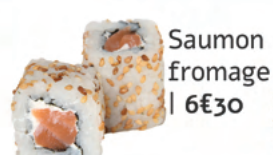
Saumon fromage | 6€30