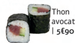
Thon avocat | 5€90