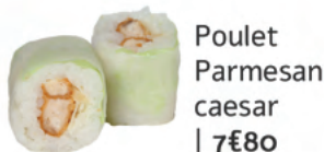
Poulet Parmesan caesar | 7€80