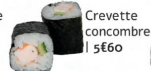
Crevette concombre | 5€60