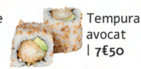
Tempura avocat | 7€50