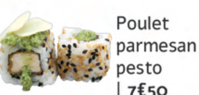
Poulet parmesan pesto | 7€50