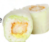
Tempura curry | 7€60