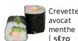
Crevette avocat menthe | 5€70