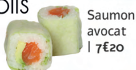
Saumon avocat | 7€20