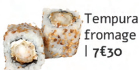
Tempura fromage | 7€30