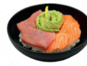
Saumon thon | 17€50