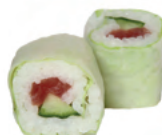
Thon concombre | 7€70