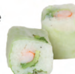
Crevette avocat menthe | 7€50