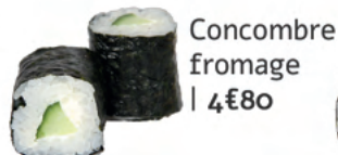
Concombre fromage | 4€80