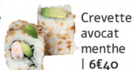
Crevette avocat menthe | 6€40