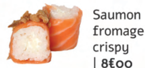
Saumon fromage crispy | 8€00