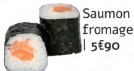
Saumon fromage | 5€90