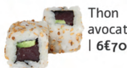
Thon avocat | 6€70