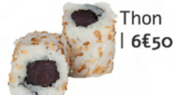
Thon | 6€50