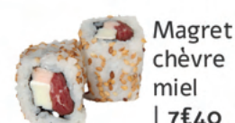
Magret chèvre miel | 7€40