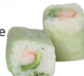
Crevette avocat | 7€50