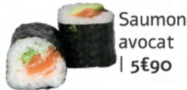
Saumon avocat | 5€90