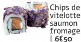
Chips de vitelotte saumon fromage | 6€50