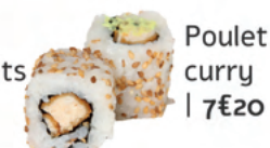
Poulet curry | 7€20