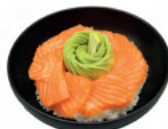
Saumon | 17€50