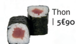
Thon | 5€90