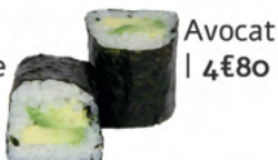
Avocat | 4€80