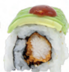
Chicken rolls Poulet frit épicé, avocat et sce kimchi | 9€50