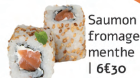
Saumon fromage menthe | 6€30