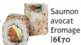
Saumon avocat fromage | 6€70