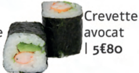
Crevette avocat | 5€80