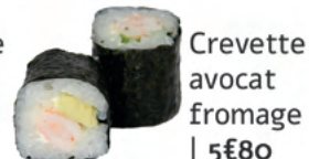
Crevette avocat fromage | 5€80