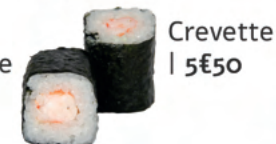
Crevette | 5€50