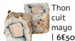
Thon cuit mayo | 6€50