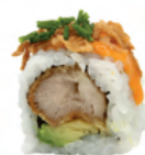
Karaage Rolls Poulet karaage, avocat, oignons frits, ciboulette et sce mayo sriracha | 9€50